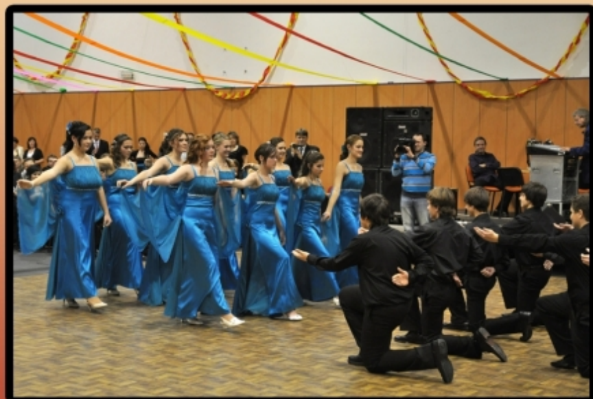
První kroky choreografie