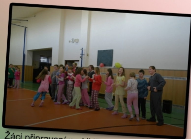
Žáci připravení na HUTUTU