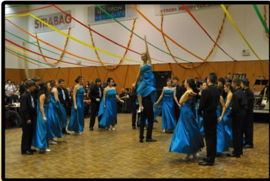
Vrcholný prvek polonézy