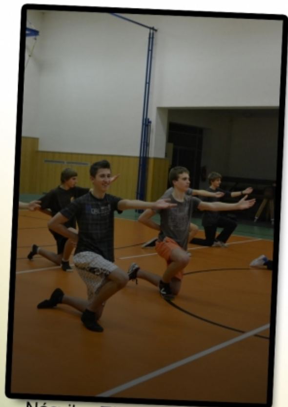
Nácvik v Tělocvičně